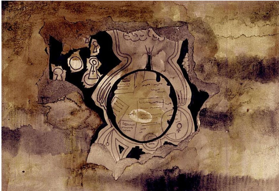
Illustration: Jelena Bundalovic